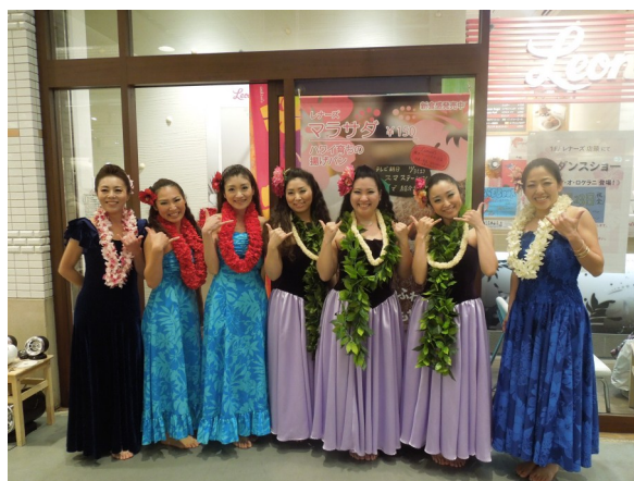
横須賀のフラハラウ ナー・ブア・オ・ロケラニ の皆様 レナーズ横須賀モアーズシティ店前にて