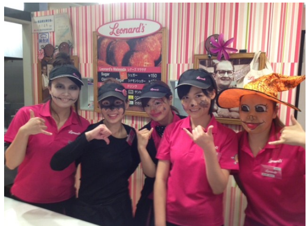
Folksがハロウィン仮装で営業！