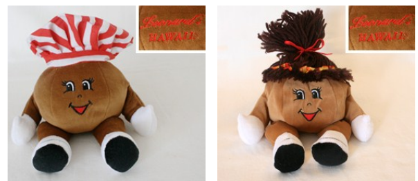
ハワイで販売されているベイビー

販売開始日時の詳細は、店頭でも告知をいたしますが、FacebookやTwitterにて随時更新していくので、チェックしてください！