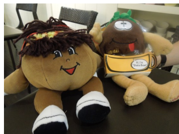
Island Vintage Coffeeのマスコット とマラサダベイビー