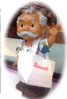
従来のトートバッグ

【先月号のクイズ】Q 日本のレナードのWEBサイトのトップページには何匹のマラサダベイビーがいるのでしょうか？ A 5匹